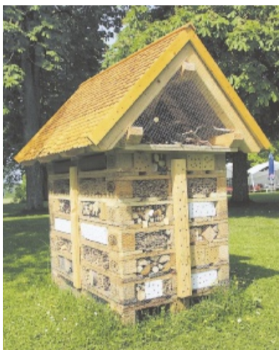
Auch Insekten finden in der Luisenlinik eine schöne Unterkunft.

zugeschnittenen Arbeitszeitmodellen wird den Mitarbeitern eine bestmögliche Work-Life-Balance ermöglicht. Im Rahmen eines betrieblichen Gesundheitsmanagements werden zudem sportliche Betätigungsmöglichkeiten angeboten.