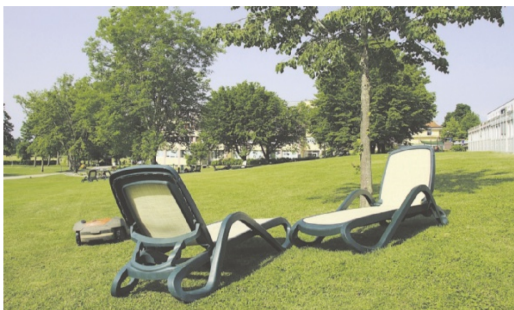
Die malerische Umgebung der Luisenlinik, etwa beim alten Pförtnerhaus (links) oder auf einer der schönen Liegewiesen (rechts), lädt dazu ein, die Seele baumeln zu lassen und neue Kraft zu schöpfen.