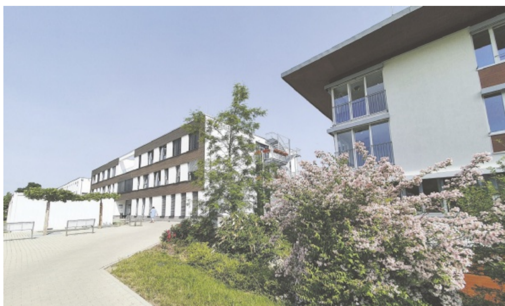
Zu den Gebäuden auf dem Gelände der Luisenlinik gehören unter anderem das Bettina-Falk-Haus (links) wie auch das Rolf-Wahl-Haus (rechts).