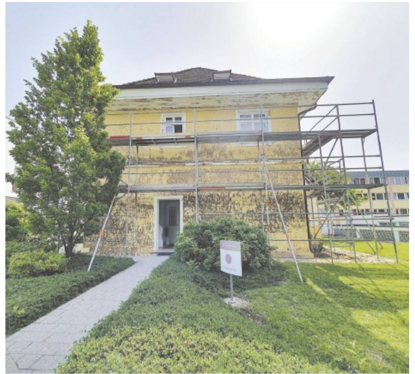
In der Luisenlinik ist man kontinuierlich dabei, das bestehende Gelände zu erweitern und auszubauen. So werden aktuell etwa Sanierungsarbeiten am Therapiezentrum durchgeführt.

Das Thema Nachhaltigkeit wird bei „der Luise“ nicht nur auf ihre Gebäude angewandt, sondern gilt auch für die Mitarbeiter: „Im Grunde gibt es nur unbefristete Verträge, wir besetzen ➔