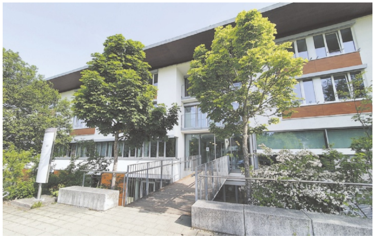
Die Kinder- und Jugendpsychiatrie der Luisenlinik bietet eine vollstationäre und eine teilstationäre Behandlung und eine Psychiatrische Institutsambulanz an.