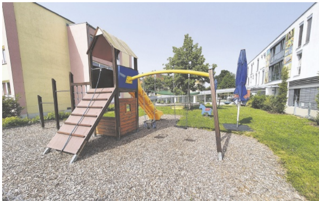
Möglichkeiten zur Erholung gibt es in der Luisenlinik viele. Während Erwachsene auf dem Schachfeld vor dem Stammhaus (links) gegeneinander antreten können, gibt es für den Nachwuchs verschiedene Spielmöglichkeiten, wie etwa rechts zu sehen auf dem schön angelegten Spielplatz zwischen dem Haupt- und Bettina-Falk-Haus.

➔ Aufstiegsstellen vorrangig intern“, heißt es auf Anfrage der NECKAR-QUELLE. Durch eine vorausschauende Personalpolitik werden Überstunden, die es gerade im medizinischen Bereich nicht selten gibt, möglichst minimiert; zusammen mit individuell