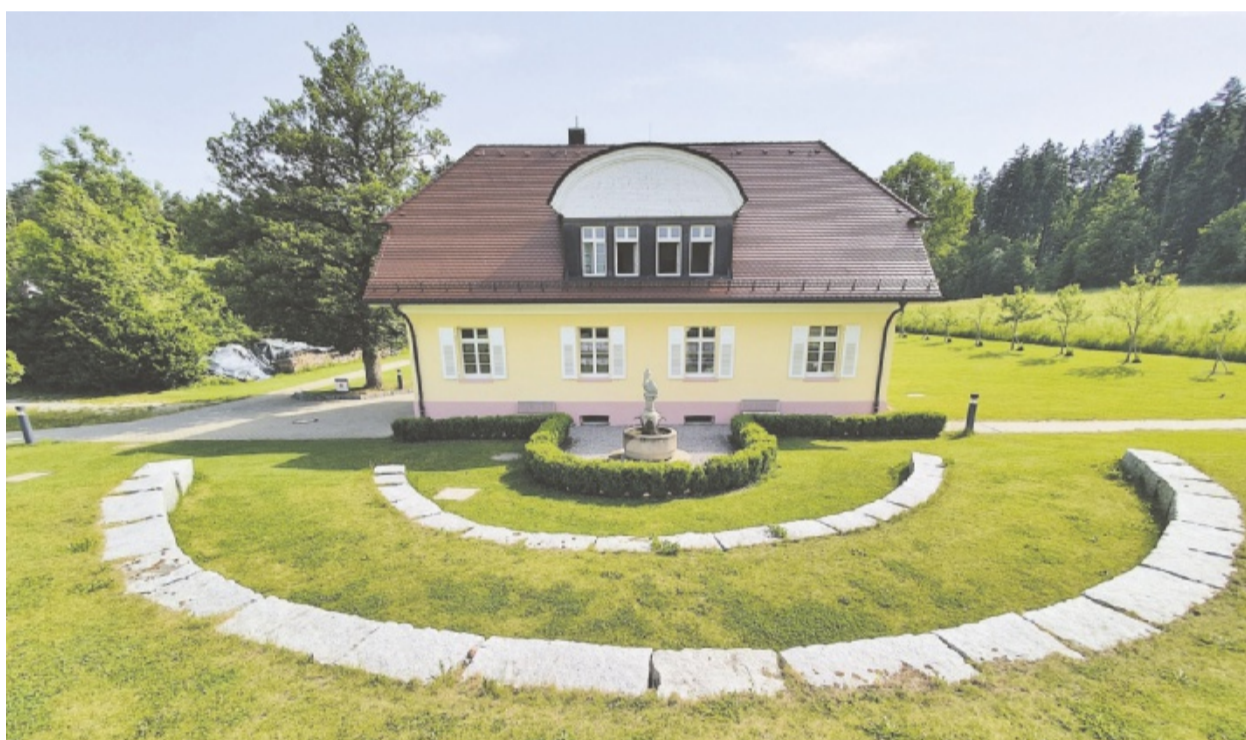
Eine Oase der Ruhe und Erholung: Die Gartenanlage seitlich der Klinikschule.

@ Weblink: Weitere Informationen zu den Angeboten der Luisenlinik gibt es im Internet unter www.luisenlinik.de .