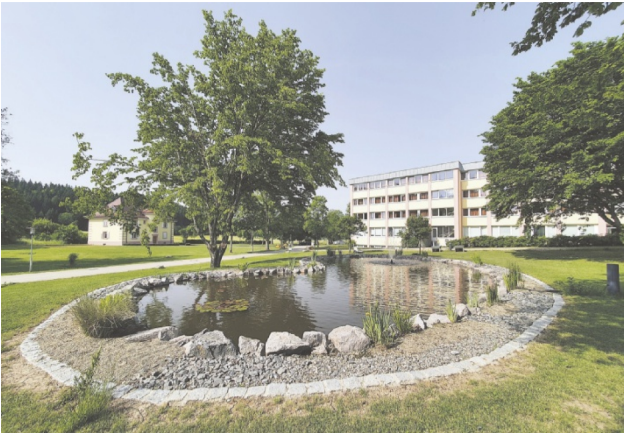
Die weitläufigen Parkanlagen, hier der Teich vor dem Haupthaus, links ist das Pförtnerhaus zu sehen, sollen den Patienten helfen, Distanz zum Alltag zu gewinnen.

➔ Der Erfolg bringt weiteren Platzbedarf mit sich. Nachdem sich die Luisenlinik über zwei Jahre lang vergeblich um das Haus Hohenbaden bemüht hat, soll ab Herbst diesen Jahres die Kinder- und Jugendpsychiatrie um eine weitere Etage erweitert werden. Die Planungen für diese Erweiterung hierzu sind bereits im Gange, der Bauantrag ist gestellt.