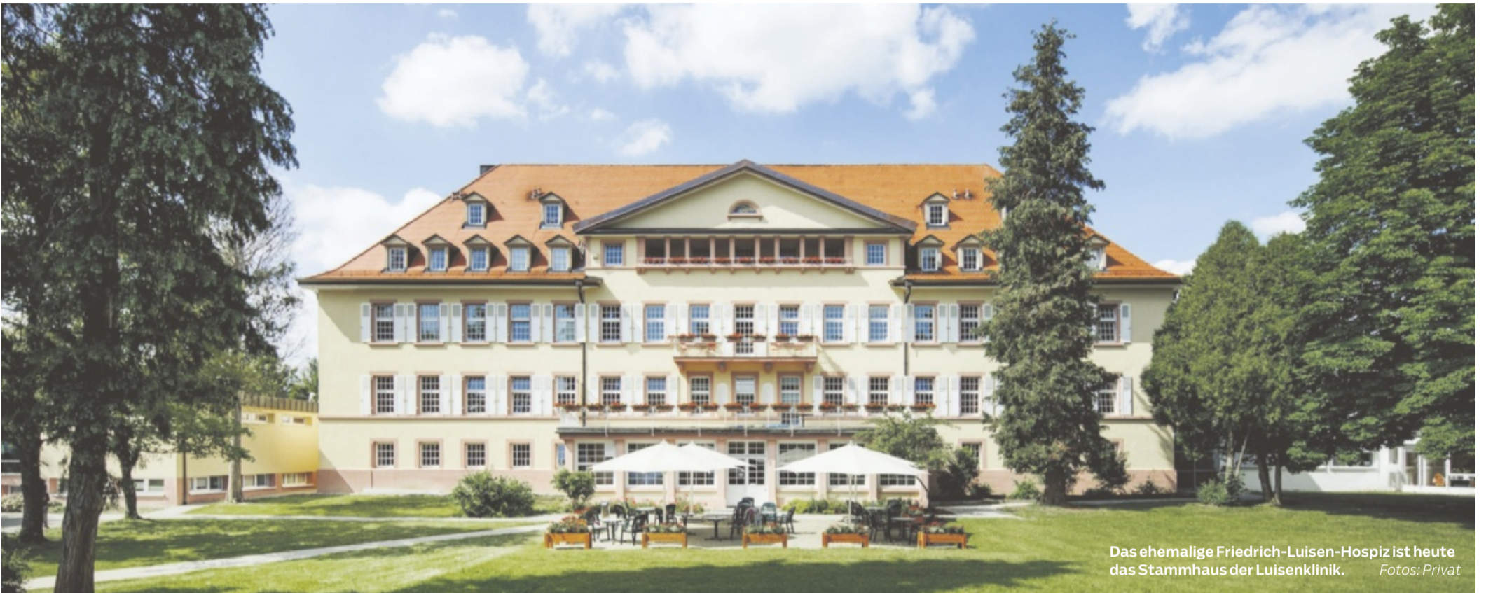
Das ehemalige Friedrich-Luisen-Hospiz ist heute das Stammhaus der Luisenlinik.